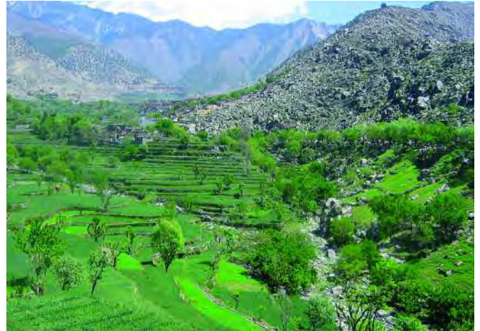
Tal von Dare Nor. Die landwirtschaftliche Nutzfläche ist knapp, eine Großfamilie muss ihr Einkommen auf ca. 3 000 m 2 Land erwirtschaften.