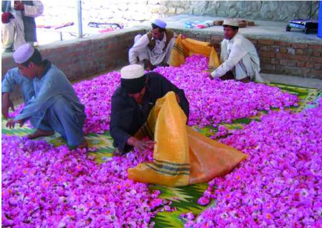
Rosen werden ausgelesen und für die Trocknung vorbereitet.